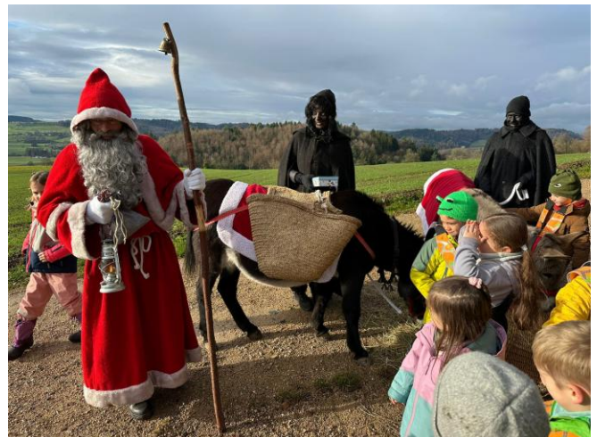
Das Team Eggliswil wünscht schneesichere Sportferien