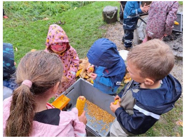
Waldtage im Kindergarten